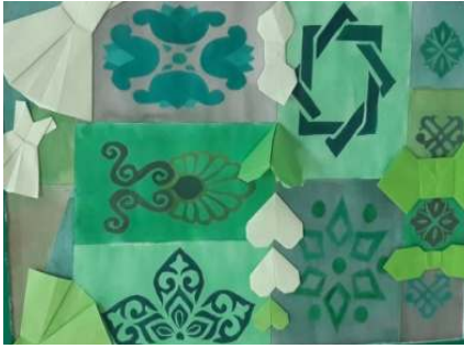
المشغولة الثانية عشر