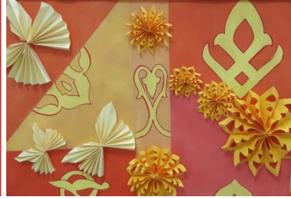
المشغولة السابعة عشر