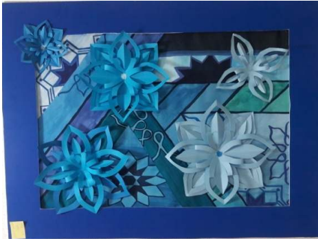
المشغولة السادسة عشر