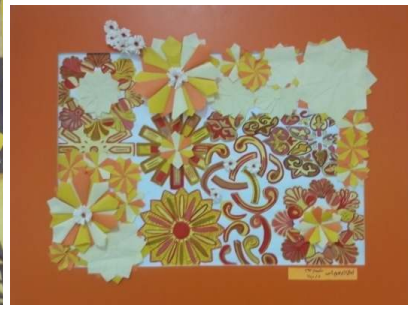
المشغولة ثلاثة وعشرون