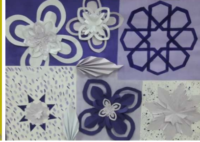
المشغولة التاسعة عشر