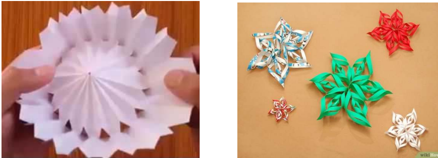
شكل (٣) نماذج الاشكال منفذه بتقنية الكيرجامي (٣)

يستخدم فن الأورجامي كأسلوب للتعبير " باعتباره عملية عقلية ديناميكية غير أننا لم ندرس الهدف من ذلك ويجعل نشاط التعبير ممكنا من الناحية التكتيكية منها الإنفاق من الطاقة العضلية ومنها محاكات مناشط الرسم أو التشكيل لدى الكبار (٤)