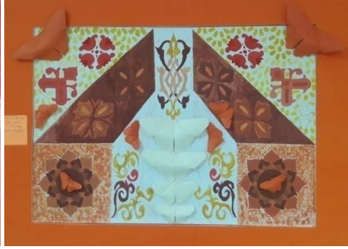
المشغولة الخامسة وعشرون