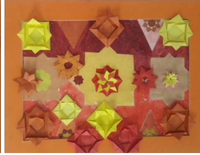
المشغولة الواحد وعشرون