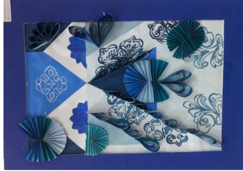
المشغولة الثالثة عشر