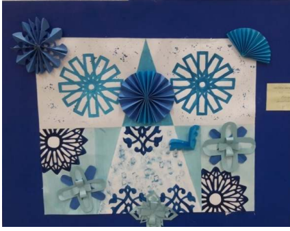
المشغولة الرابعة عشر