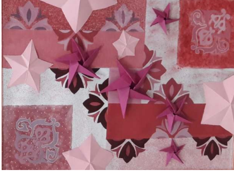
المشغولة السادسة وعشرون