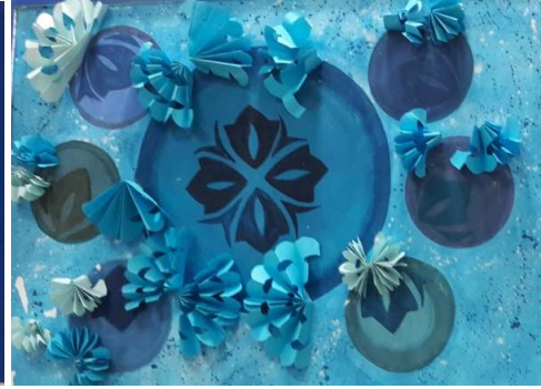
المشغولة الخامسة عشر