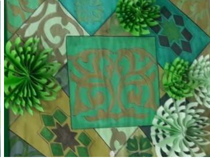
المشغولة الحادية عشر