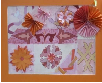
المشغولة اثنان وعشرون

تحقق التجسيم بالمشغولات من خلال تعدد طبقات الكرجامى مما أعطى إحساس بالعمق داخل المشغولات الفنية .