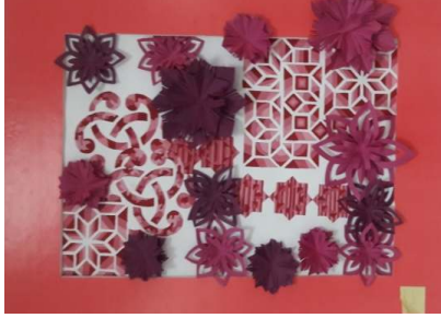
المشغولة الثامنة عشر