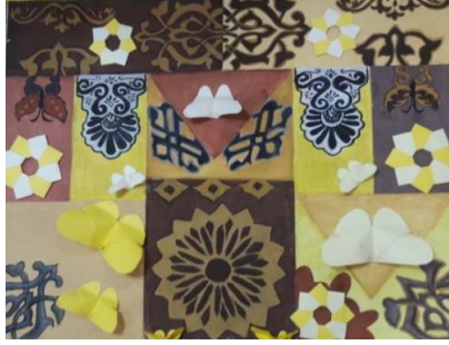
المشغولة الربعة وعشرون